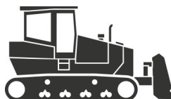
Machines de Construction